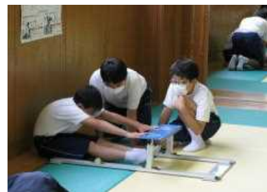
保健体育の授業で、仲間同士協力して体力測定を行う1年生

今後は、桐生市から出されていた「学校再開に向けたガイドライン」を参考にして、コロナウイルス感染症の感染防止に最大限の努力を払いながら、さらに通常の学校生活に近づけていきたいと思っています。