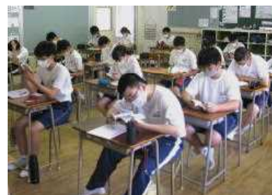
集中して授業に励む3年生

しかし、どの生徒もよく我慢して頑張ってくれました。さすがは3年生という印象がとても強く、授業中の態度もしっかりしていて素晴らしかったです。