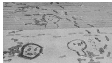
誰かが雪の上に描いたアート作品

梅田中学校でも、職員が朝から雪かきをして、子供たちを迎えました。無事、子供たちが登校し、授業も始まったところで、ふと、駐車場を見ると、何やら雪の上にアートが描かれていました。子供たちなりに、雪の一日を楽しんでいたようです。