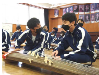
うまく弾けている？ 結構いいよ!

1年生の子供たちが、音楽の時間に日本の伝統楽器の「箏」の学習に取り組んでいます。音楽のカリキュラムには、各学年で学習する内容に、日本の伝統的な音楽に親しむという項目が用意されています。1年生が学習するのは、奈良時代に中国