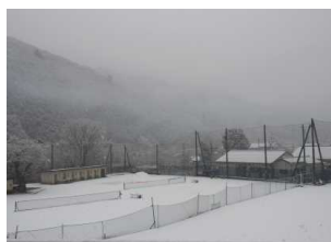
校庭も真っ白になりました

2月10日(木)は日本全国で雪が降りました。梅田地区でも何年かぶりに積雪を記録しました。