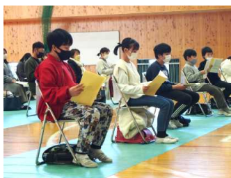
真剣な表情で話を聞けていました

2月3日(木)は、来年度、梅田中学校に入学する予定の小学6年生の児童と保護者の方を対象に、新入学説明会を実施しました。当日は、体育館に集まった