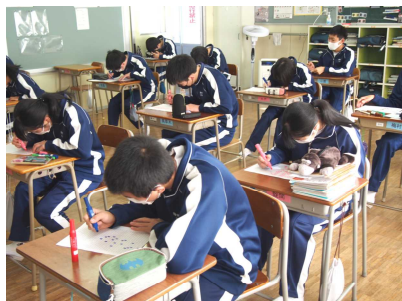
全校生徒で色づけに取り組みます