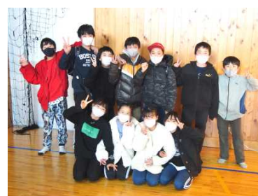
新1年生の子供たちです

体育館で説明を聞いた後、子供たちは英語の授業を体験しました。こちらも、大変、楽しく時間が過ごせたようです。入学式を迎えるのが早くも楽しみになった子供が、増えたようです。令和4年度の入学式は、4月7日(木)午後2時からになります。