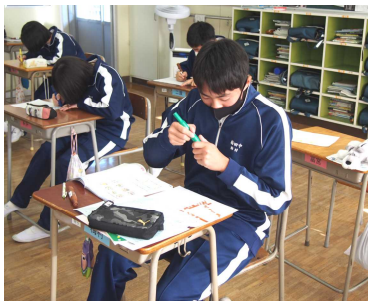
3年生も楽しそうに取り組んでいます

今年の原画も、色鮮やかでとてもきれいな図案です。アプリケーションソフトにより、画像がモザイク状のマスに変換され、全学年の子供たちが手分けをしてマジックペンで色を塗ります。正直に言うと、この状態では、まだ、全く何が何だかよくわかりません。根気と集中力のいる作業ですが、変換された後の77枚のシートの全てに色がつき、完成した時には、素晴らしい作品になります。