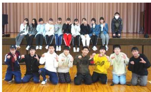
踊りきった後の充実した子供たちの笑顔

皆と一緒に踊るのもこれが最後。体育の表現の授業で3年生の子供たちが、ダンスに取り組みました。各班ごとに、自分たちで曲を決め、皆で協力して振り付けを考え、趣向を凝らしたダンスが完成をしました。発表会では、かなりの時間をかけて作り上げたのだろうと感心をしていたのですが、実際にかけた体育の授業での時間は8時間程度と聞き、出来映えの良さに思わずびっくりしてしまいました。特に、女子のダンスは、よくテレビでも放映されている「高校生ダンス甲子園」並です。しかし、一生懸命に取り組んできたのには、もうすぐ卒業を迎える前に、クラス全員で形あるものを残したい、という子供たちの純粋な想いがあったからこそできあがったものなのだと思います。力一杯、ダンスを踊りきった後は、さわやかな達成感が子供たちの心に残りました。