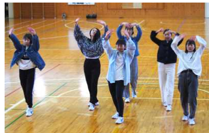
各班に分かれ、趣向を凝らして取り組みました。どの班もとても楽しそうでした

皆と一緒に踊るのもこれが最後。体育の表現の授業で3年生の子供たちが、ダンスに取り組みました。各班ごとに、自分たちで曲を決め、皆で協力して振り付けを考え、趣向を凝らしたダンスが完成をしました。発表会では、かなりの時間をかけて作り上げたのだろうと感心をしていたのですが、実際にかけた体育の授業での時間は8時間程度と聞き、出来映えの良さに思わずびっくりしてしまいました。特に、女子のダンスは、よくテレビでも放映されている「高校生ダンス甲子園」並です。しかし、一生懸命に取り組んできたのには、もうすぐ卒業を迎える前に、クラス全員で形あるものを残したい、という子供たちの純粋な想いがあったからこそできあがったものなのだと思います。力一杯、ダンスを踊りきった後は、さわやかな達成感が子供たちの心に残りました。