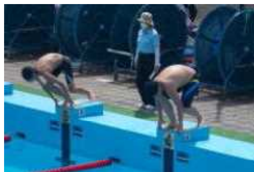
桐生市総合体育大会水泳部

「 習慣は第二の天性 」という言葉があります。特に勉強については、 決まった時間に、きまった場所で取り組むことを心がけさせてほしいです。